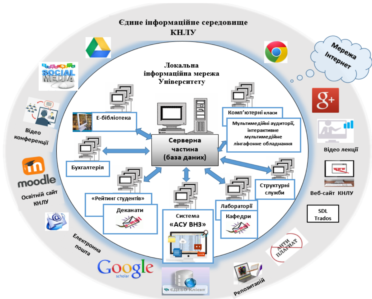
Мал. 1.1. Інфраструктура єдиного інформаційного середовища КНЛУ

Загальна інфраструктура єдиного інформаційного середовища КНЛУ представлена на малюнку 1.1.