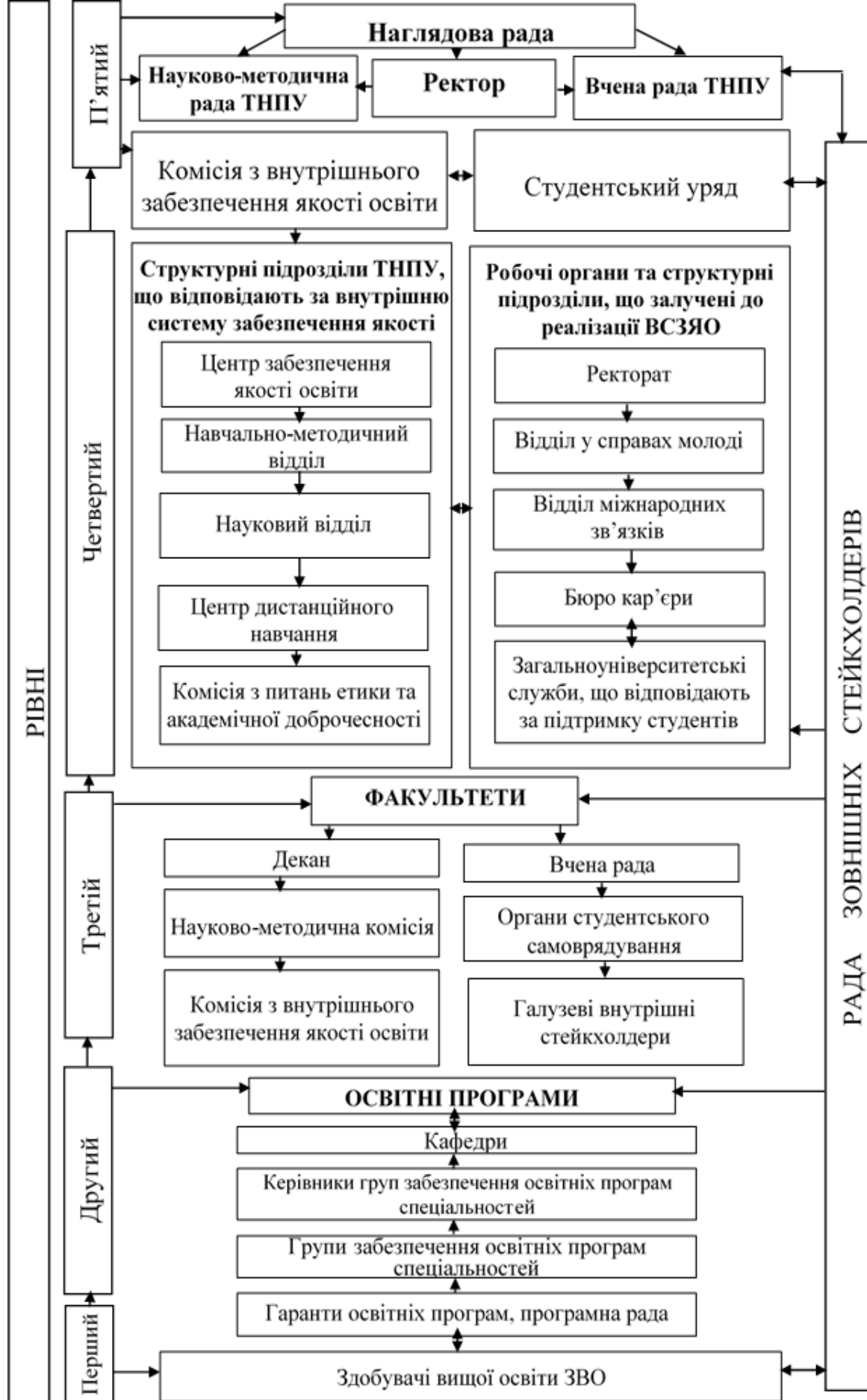
Рис.1. Інституційна модель системи управління якістю освітньої діяльності ТНПУ